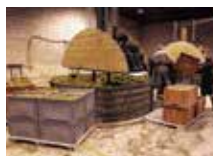
昔ながらの垂直式压榨機