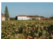
畑の中に佇むシャトー

この醸造所の歴史は十字軍遠征以降の中世ヨーロッパで活躍したテンプル騎士団に由来し、1300年代初頭に建てられたシャトーの名前「Temple」もテンプル騎士団(Templier)に因んでいます。