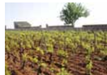
樹齢50年以上の古木たち

ガニャール・ドラグランジュ社は、シャサーニュ・モンラッシェ村で、200年以上、7世代に渡りワイン造りを行う老舗中の老舗です。