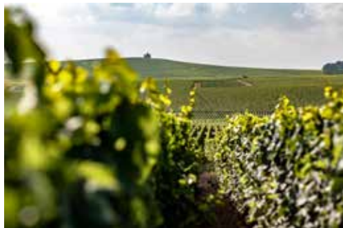
シャンパンを製造するミシェル・ジュネ社

東京の老舗フランスワイン輸入元、株式会社フィネスより厳選されたワインを仕入れております。そのワインはリーファーコンテナ（室温が14～15℃に一定管理されたコンテナ）に入ってフランスから日本まで輸送されます。