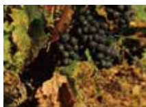
一級のピノ・ノワール

ジュヴレ・シャンベルタン村の外れに居を構えるこのドメーヌは、6世代に渡ってブルゴーニュ地方に畑を所有し、「アラン・デュカス」やパリの3つ星レストラン「ラセール」でも使われています。