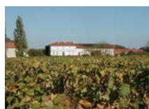
畑の中に佇むシャトー

この醸造所の歴史は十字軍遠征以降の中世ヨーロッパで活躍したテンプル騎士団に由来し、1300年代初頭に建てられたシャトーの名前「Temple」もテンプル騎士団(Templier)に因んでいます。