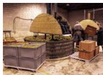
昔ながらの垂直式压榨機