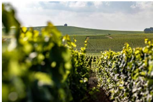
シャンパンを製造するミシェル・ジュネ社

東京の老舗フランスワイン輸入元、株式会社フィネスより厳選されたワインを仕入れております。そのワインはリーファーコンテナ（室温が14～15℃に一定管理されたコンテナ）に入ってフランスから日本まで輸送されます。