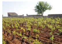
樹齢50年以上の古木たち

ガニャール・ドラグランジュ社は、シャサーニュ・モンラッシェ村で、200年以上、7世代に渡りワイン造りを行う老舗中の老舗です。