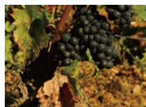
一級のピノ・ノワール

ジュヴレ・シャンベルタン村の外れに居を構えるこのドメーヌは、6世代に渡ってブルゴーニュ地方に畑を所有し、「アラン・デュカス」やパリの3つ星レストラン「ラセール」でも使われています。